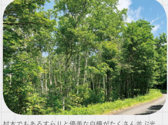
村木でもあるすなりと優美な白樺がたくさん並ぶ光景が。