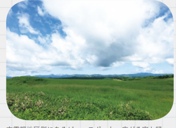
支雪裡地区側にあるビュースポット。広がる空と緑の草地のコントラストは、清々しいほどです。