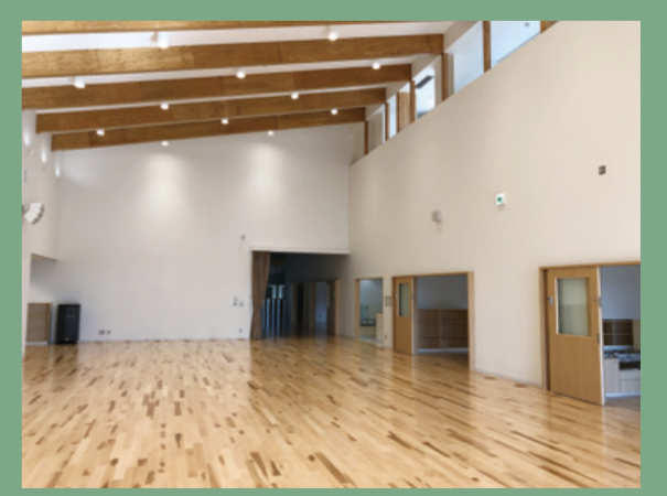
伐採した木材は、主に村内の公共施設の建材として活用。写真は、カラマツ材を使った村の保育園。木の温もりが感じられます。