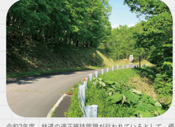
令和2年度、林道の適正維持管理が行われており、優秀賞(林道維持管理部/一般社団法人北海道治山林道協会)を受賞。