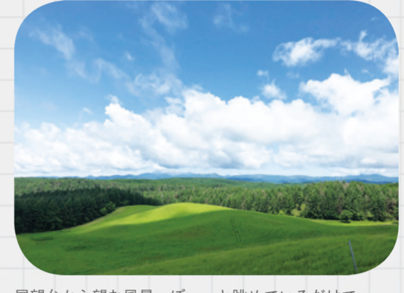
展望台から望む風景。ぼーっと眺めているだけで、心が解き放たれていきます。