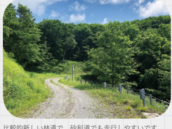
比較的新しい林道で、砂利道でも走行しやすいです。