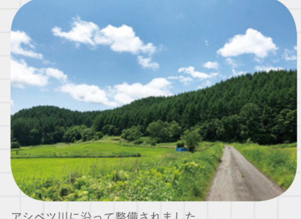
アシベツ川に沿って整備されました。