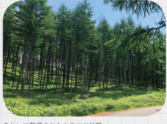
きれいに整備されたカラマツ林帯。