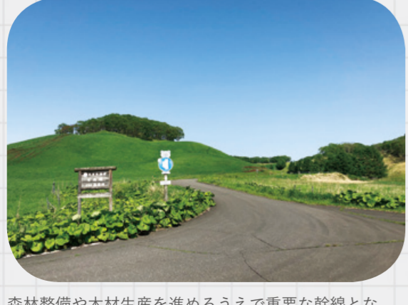
森林整備や木材生産を進めるうえで重要な幹線となります。