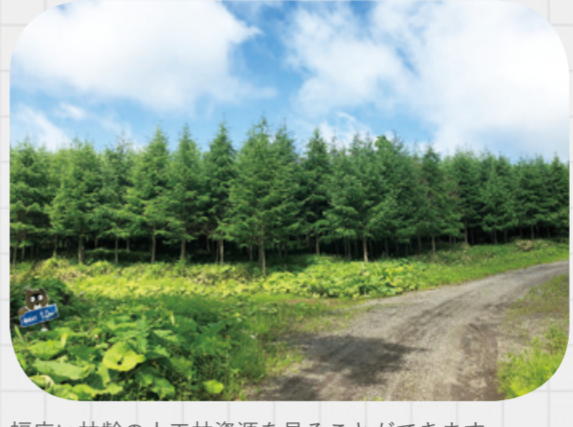
幅広い林齢の人工林資源を見ることができます。