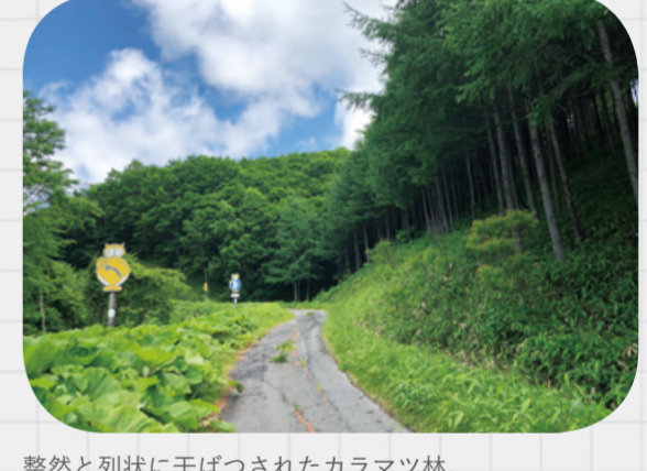
整然と列状に干ばつされたカラマツ林。